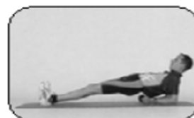
3 Chaîne postérieure