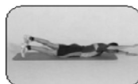
6 Dorsaux (fixe puis mouvements)