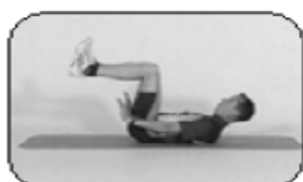
4 Abdos droits (varainte oblique)