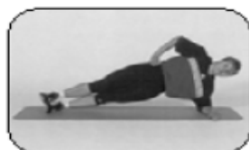
2 Chaîne latérale